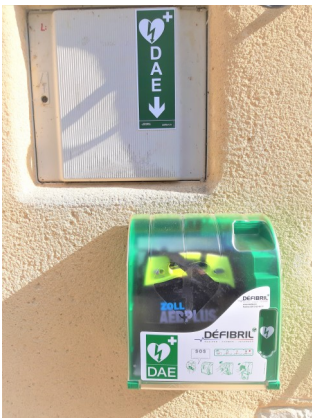
Le Défibrillateur Automatisé Externe installé sur la façade de la salle d'animation.

E n France, on compte près de 50 000 morts subites d'adultes ou par arrêt cardio-respiratoire (ACR), et un tiers de ces personnes ont moins de 55 ans. Or, 90 % de ces arrêts cardio-respiratoires nécessitent une défibrillation. Les chances de survie d'une victime passent de 2 à 33%, si les témoins appellent le 15 ou le 112 , pratiquent le massage cardiaque et utilisent un défibrillateur. La