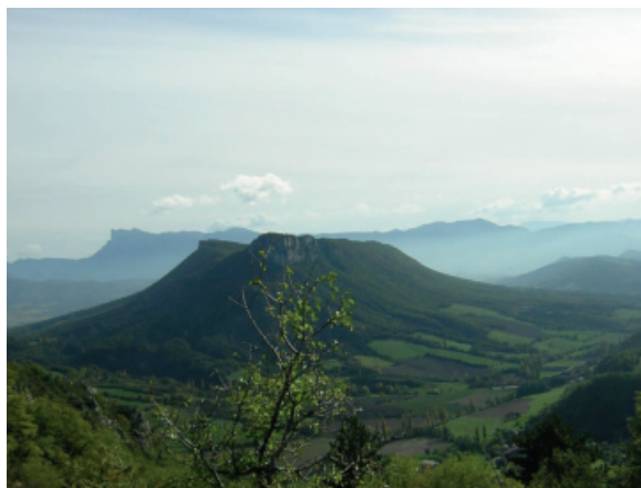
Le synclinal de Saint Pancrace, bassin versant des eaux pluviales

La source du Vivier est située en contrebas du cœur du synclinal de Saint Pancrace. La roche-réservoir est constituée de calcaire du Crétacé supérieur sous lequel est située une couche imperméable de marne. Ce ne sont donc que les pluies tombant sur Saint Pancrace qui alimentent ce réservoir naturel qui conserve l'eau grâce à cette couche imperméable. Le volume de cette source dépend donc intégralement de la pluviométrie sur Saint Pancrace.